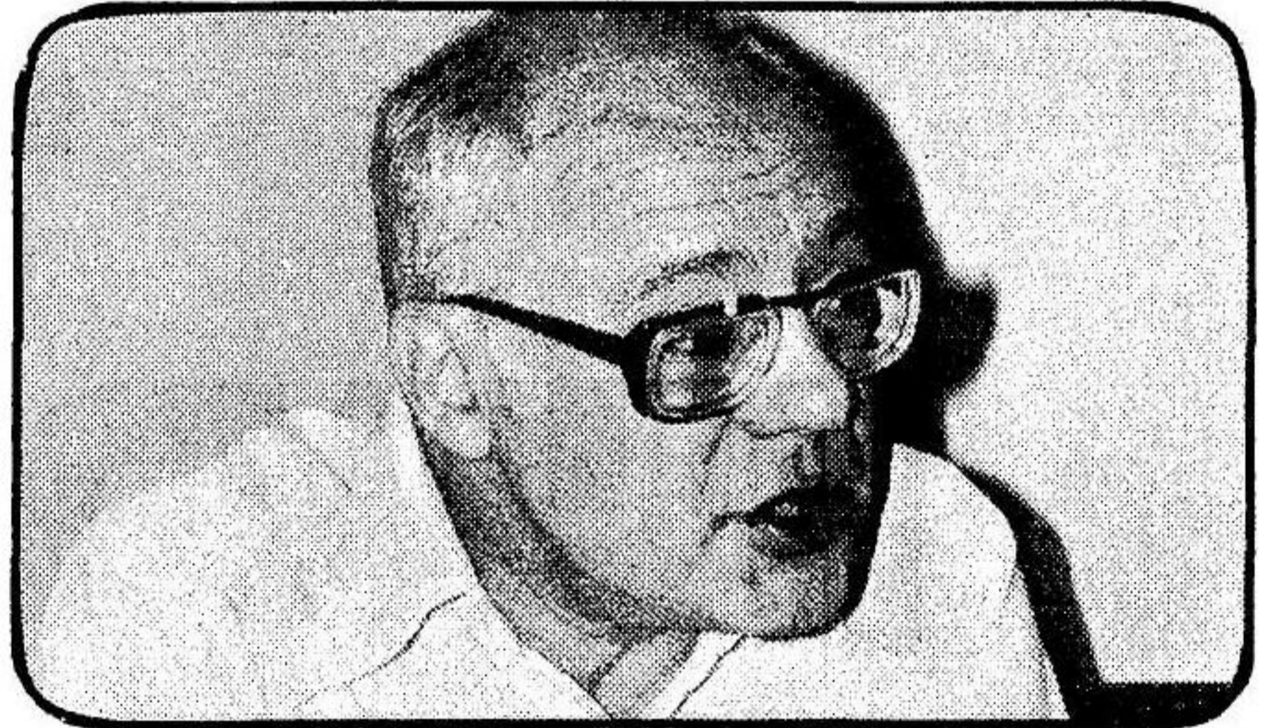
פרופ' עוזר שילד: „גם מי שלא שמח — אין לו סיבה להתייכר“