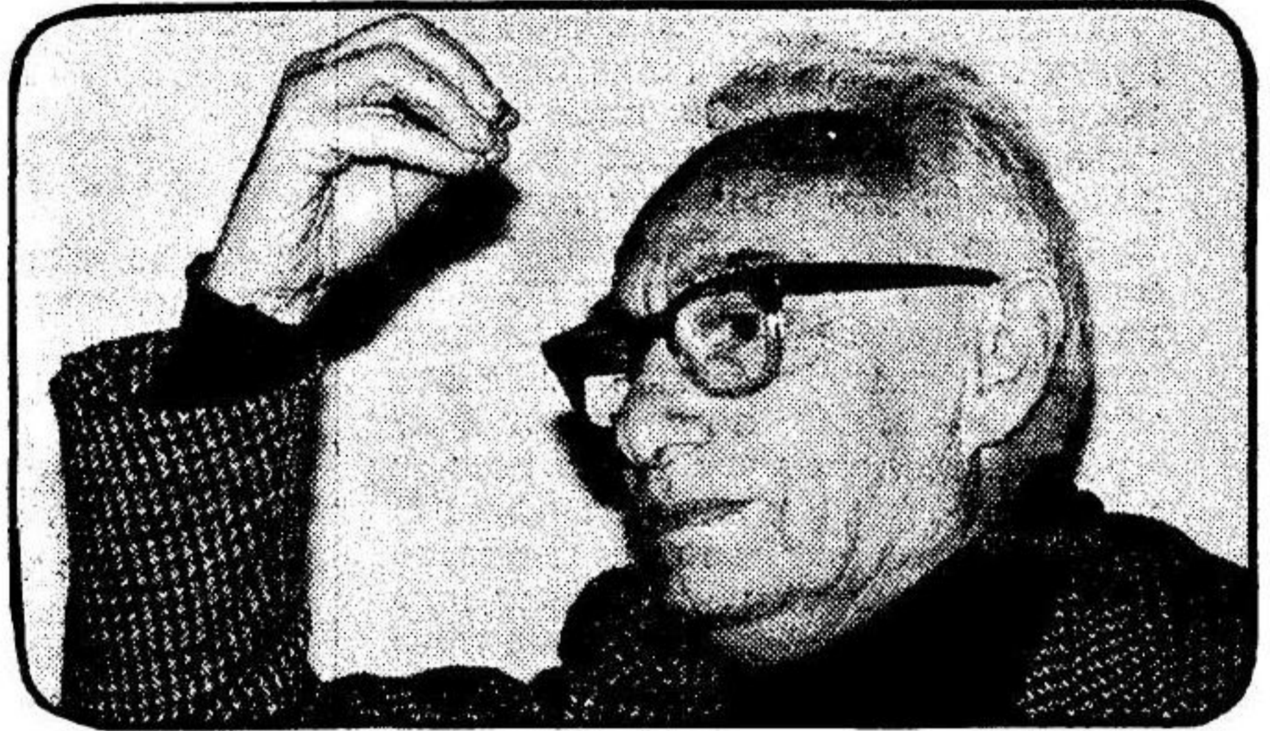
ד"ר ישראל אלדד: „צריך לחדש את המצעד הצבאי“