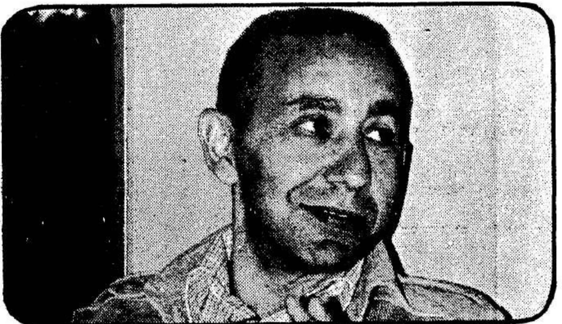
פרופ' שלמה ברזניץ: „העם הזה אינו מסוגל להפגין שמחה אמיתית“