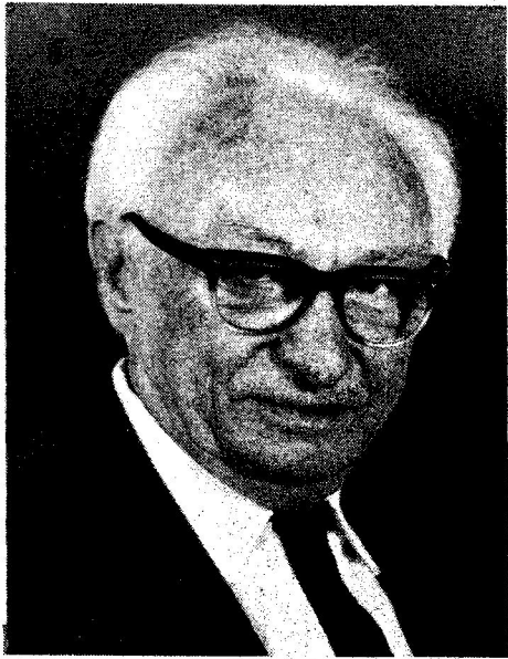
פרופ' ישראל אלדד

דה. הרבה פור ומזל. בפסח אין "מזל". יש מאבק כוחות היסטוריים. ממצרים יוצאים למעשה גאולתי. בשושן נשארים לשתות ולשלוח מנות. אין אף זכר למה שארע לאס-תר לאחר הישועה. נשארה בארמון (הרמון הורמוני מאוד) של הערל ההוא? למה? אחד שורש ודאי שלא התגייר. אסתר התקינה מקווה בהרמונו? איזו מין ישועה יהודית כאן? הכל אנרכיה, בלגן, שישו ושמחו. ביציאת מצרים ישנה שירה, שירה גדולה, שירת הים. אין שום שירה במגילה. שתייה - כן, שירה - לא.