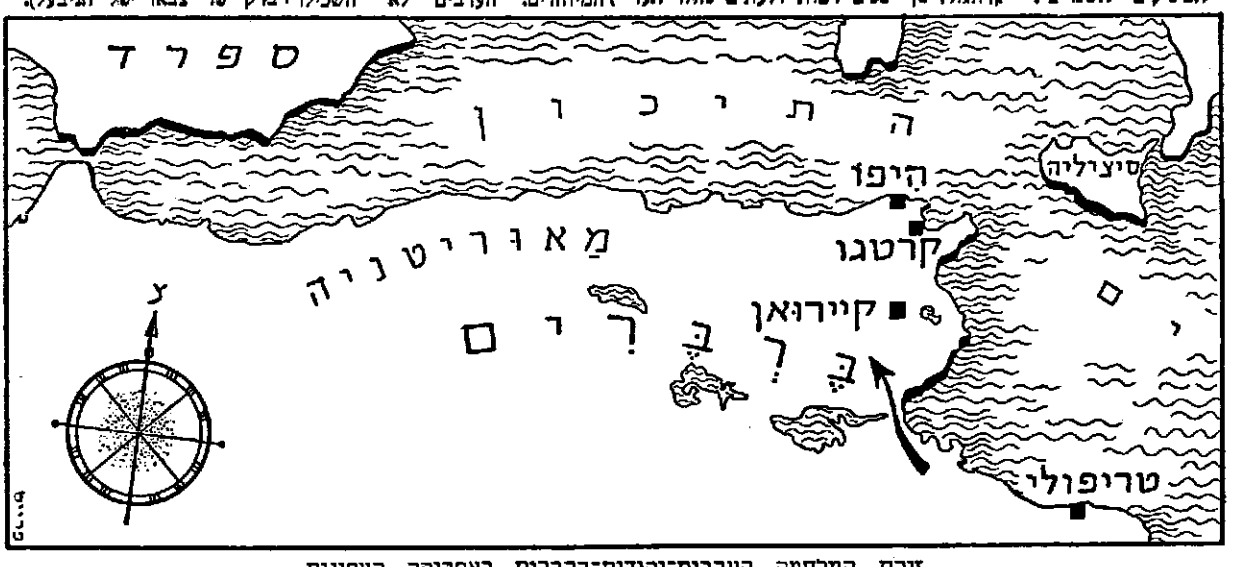
ידת המלחמה הערבית-יהודית-ברברית באפריקה הצפונית

כוחות הצפוניים של אפריקה המערבית היו מות זרות רבים ישר בים הים התיכון. הערים הח' שבות ביותר בשטחים אלה נוסדו ע"י הפיניקים השמיים: קרתגו,