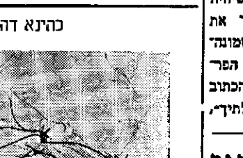
היא עצרה את המבול האדיר של ה-איסלם אשר הציף את ארצות המזרח. היא הדפה את התקפותיהם של צבאות-

הרבנים טוענים שאבו-עיסה תיקן והקדים בהלכות הדת מבלי שיהיה מוסמך לכך: אם כי השאיר את התפילות העיקריות, כגון שמועד עשרה וקריאת שמע ושלושת הברכים קים שלאחר-ההנה על סמך הכתוב בהללים „שבע ביום הללתיך“.