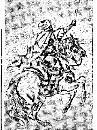
אבו-עיסה: למיגור המלכים הרשעים, לשחרור ירושלים...

כפי שמוזכרים מתבוננים יהודים נושאים הרבה לרבותיהם להצטרף לצבאו של אבו-עיסה מתוך אמונה ובטחון שיעלה בידו לשחרר את ירושלים.