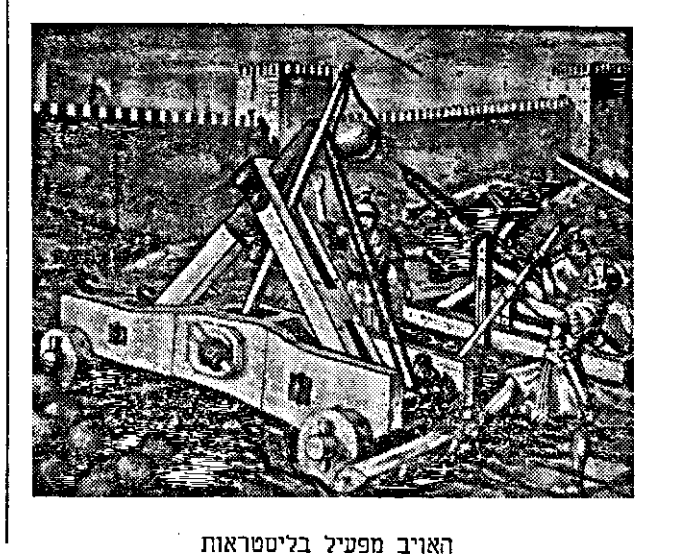
האויב מפעיל בליטראות

אין לתאר את השמחה שהשתררה במחנה הרומיים אחרי שריפת בית המקדש בירושלים — נודע מפי יהודים שנשלו בשבי והצליחו לברוח אל העיר העליונה.