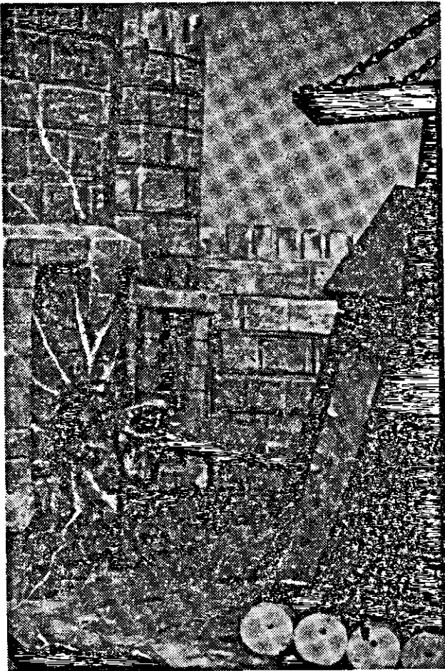
אחרי שורה של כשלונות עלה בידו הרומיים להפעיל כמה ממכונות המלחמה הגדולות שלהם ולקרר בכמה מקומות את חומות ביתרנו. בתמונה זו נראה איל-ברזל בפעולה. הוא מאוחז סוג שנספר ע"י אנשיו של יוחנן מגוש חלב.