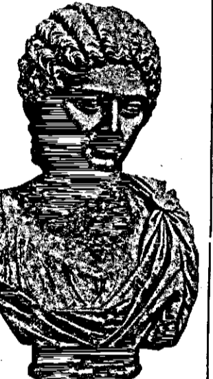
פרוטומה של אשת הקיסר

הקיסר לוציוס ספטימוס סחירוס נולד לפני 48 שנה בלפטיס מגנא אשר בפרובינציות אפריקה. למשפחה סחירוס פונית.