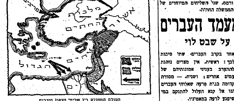
הגושן המחוזק בין שלישי הצפון והדרום

קדש — בידי החתים החוזה מכיר בשלטונה העליון של מצרים בכנען הדרומית ושל החתים בכנען הצפונית. על ידי כך נשגרת קשר — העיר שאתונה ויטה רעמסס לכבוש לפני ששעשרה שנה — בידי החתים. לוחמכספ שלליו חקוק גוסס החוזה נמסר לידי המלך רעמסס הבוקר, לאישורה, על ידי סרס-סבו ורמס, שני השליחים המיוחדים של הממשלה החתית.