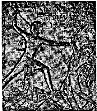
הנוגש מאי מכה את כרמי הסבור

בהודעה שפורסמה מטעם ביה"ח טרעה נאמר כי משה זה, שנחשב בעיני רבים כמצרי מלידה, אינו אלא עברי: הוא בנם של פרעה ויוכבד משפט לוי. כן נאמר בהודעה כי משה נעלם ומסתתר, אולם המשטרה ממשיכה בחקירתו ובחיפושים. הוכה שוטר-עברי המאורעות שהובילו לפרסום זה דעה סנסציונית זו מטעם הארמון, ואשר עוררו מרידה רבה בחצר טרעה. וזעזעו את ארץ גושן כולה. הלך המאורעות הללו מסתכם כולק: מן: מאי בן באקנאמן, מפקח אזורי במחלקת העבדות הצבאית. הרגיע שלושם לפרסום, היא העיר החדשה הנובית עתה מורחה לרעמסס. כולחית שלושה נוגשים מצריים