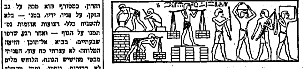
נושאים משלל בלבוש. שני נושאים ומקלחתם בידיהם.