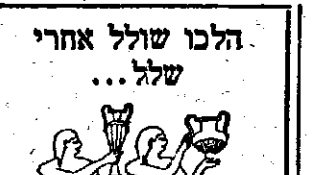
חילי מצרים עמוסי 720

כאשר הגיעו הכנענים, בברית חתם, אל תותמוס מגידו - לא יכלו להכנס עימה ליתן שלב עשירי העיר והגוף בפניו.