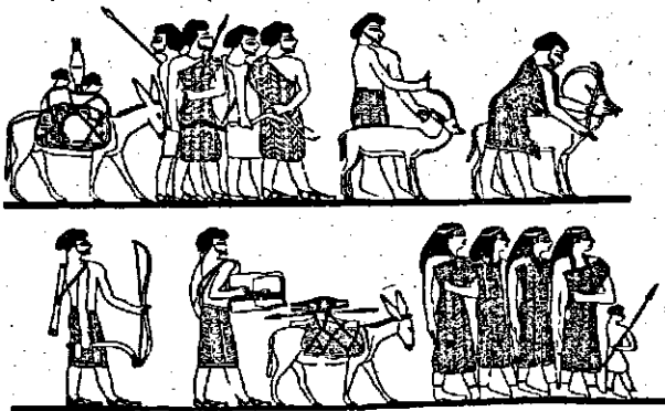
בני יעקב יורדים מצרימה