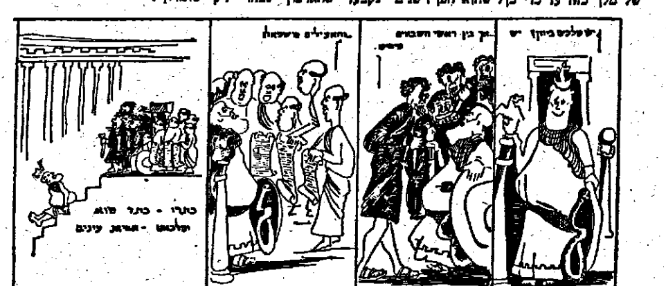
הוצאת אהרן רוס ת.ד. 8022 ירושלים

טלמנים. אצילי אתונה הצליחו לספח בלי מלחמה את חבל ארץ אלוסייה לחוף הים מול סאלאמיס. בעוד ספרטה בדרום עומדת שניג רבות במלחמה על הרחבת שלטונה על שבטי יון המפורדים. מתרחבת אותה בודכי מדינות וכובלה. אצי לי אתונה שרתו לגברי את שלטון המלוכה רוצים להוכיח להם שאפשר לתרויב ולהעשיר ארץ כל בלי מלכים ומלמיה.