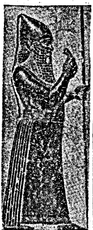
המורד הבבלי הגדול