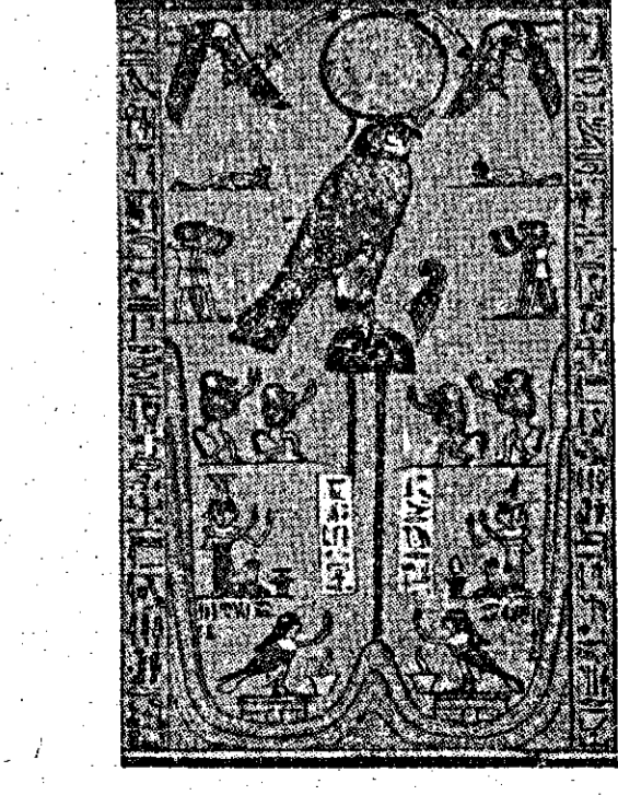
אלים 1. ו. אדם, החיים והחיים יחילו את רע אל השטם.

יש אומרים על המצרים, שהם כותמים אפרוחים, אשר לאור שיצאו ככר מביצתם. דעו הם נשאים את קדושים במצרים האסירים באכילה. דבר שני האופייני לדת המצרים היא הנפוצה בכל רחבי מצרים היא חובקות בשלושיות של אלים. לריב אב, אס ובן. (גם בבנייה ובתנועת יקרו המצרים ביהוד את סוד זה (הסוף בעמוד ג') ל'שת הביצה על גבם. שכן, אין עוד כ' כעם למצרי המתחבר בארץ. נתינו ומשמר אותה, אף על פי שמדן מן הן איבדו כל משמעות לגבן. רבים אלי פצרים. אף כי רוחק מספרים להביע לפסטר אלי גרייט. והז' 'האשון הכולט לקין הוא