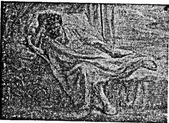
המלך בהרהורי תונה לפני צאתו לקרב

אתהוהו בנות ישראל אשר הליבשם שני משלל אויבים.