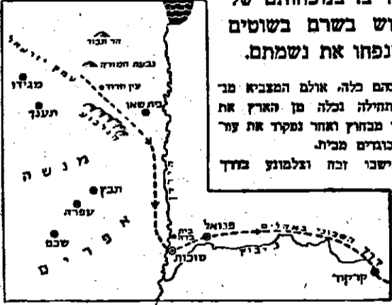
דרך הירדן אחר המדיינים מן הירדן עד סוקוט

בית ברה. על מעברות הירדן (מאת סופר דברי הימים) בפקודתו של גדעון בוצע העונש החמור על ראשי סוכות ופנואל, על סרובם לתת לחם ומים לצבא ישראל הרודף אחרי האויב. בנוכחותם של כל אנשי סוכות ופנואל נידוש בשרם בשוטים על שויים מקוצים וברקנים עד שנפחו את נשמתם.