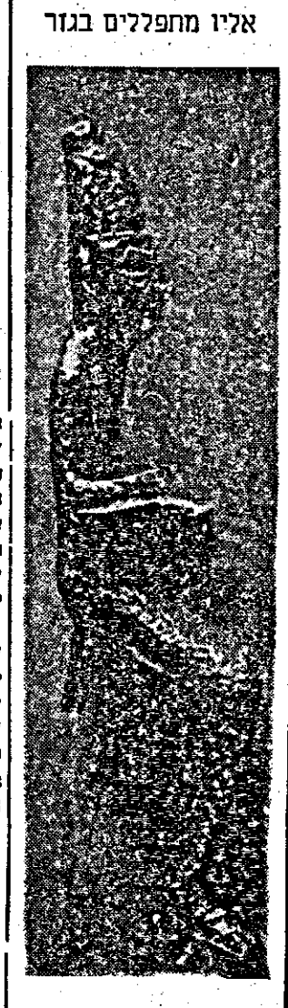
האל הכנעני דשף

חבר הכטיח עצמו בחצור, אשתו יעל — ברמה... בפעולה דיפלומטית זריזה הצליחו ראש שבט הקיני ואשתו למנוע את הפיכת אדמותיהם לשדה-קטל. בעוד שראש השבט, חבר, יצא לביקור דחוף אל יבין מלך חצור, פנתה אשתו יעל אל דבורה שניהם הבטיחו נייטראליות גמורה של שבטם. על ביקורים אלה בחצור מזה וברמה מזה מוס-רים סופרינו את הפרטים הבאים: