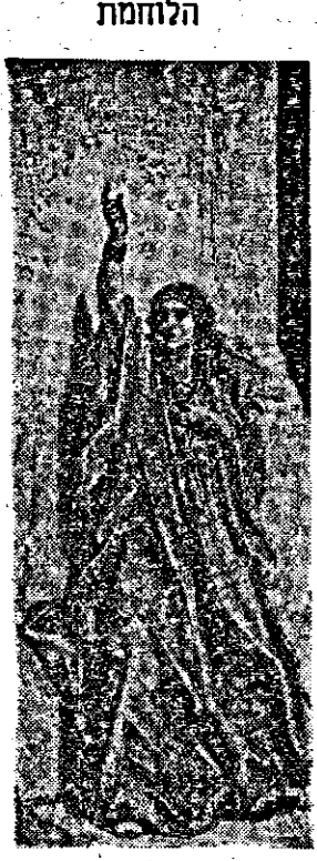
קום ברק ושבה שבין י

הולכי נתיבות חבדת החבורה ביישובתיה שנויים בקוי התחבורה וננו להודיע ללקוחותינו כי לרגל ההתקפות החוזרות ונשנות מצד מארבים כנעניים נאלצנו לבטל את פגרי השיירות לעבר-הירדן ולגליל בדרכים מגידו-בית-שאן מגידו-רקת תחזיקת העבודתה שיירותינו בדרכים תבן-בזק-יבש גלעד תבן-בזק-פחל-אפק השינויים הם זמניים בלבד!