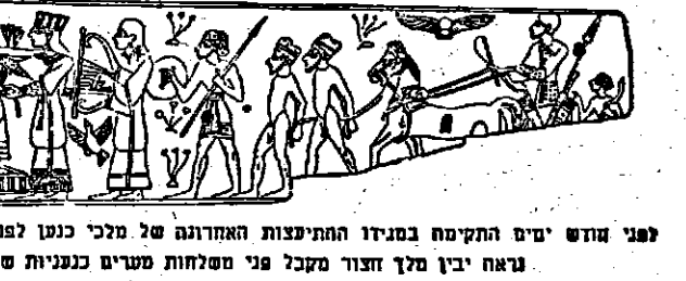
פני חזש ימים התקיים בבימדין התייעצות האחרונה של מלכי כנען לפני החלטת המלחמה. בתמונה מאת ריאה יבין מלך חצור מעל פני משלוחת סערים כנעניות שנתו המגישות לו מתנות

מעשי דבורה וברק נחפזים מדי לקום לעזרת העם. חזרו מלאי חמה ואכזבה. שבוע ימים נצטו להכות עד אשר יתאספו זקני השבט לזיון. שלוש ימים נמשכו הדיונים בעצלותיהם ורק במצאי היום השלישי באה התשר בה המתמקת: "סרם החלטנו את שמינו".