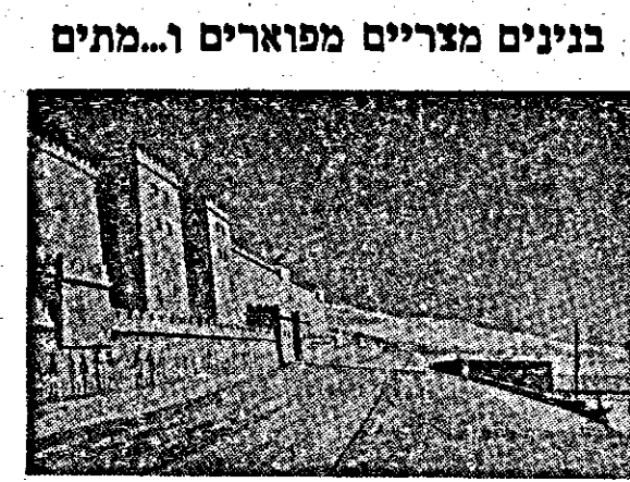
זהו הארמון הגדול במדינת ז'אבן. בנה אותו רעמסס השלישי. השנייה של החומה מעידות על השפעת סגנון כנעני. כיסו הכל דיק ועובו סמ.

הפוגה במאבק בין הכתמים הנביאים שילה. זה שבוע ימים נערכים במשכן יום יום ומובאים קרבנות לרוב לסראת המלחמה עם הכנענים.