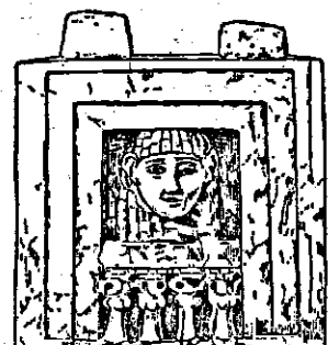
אם סיסרא נסקפת מנוד לחלוף אחר בנה חיוצא לקרב

נה ומצרים ירדה מכה מסה. מלש-תים לוחצים אותנו הורה ישראל ודחפת לעמק. לא גיורוס עיד בדרים וברו אמנית לאלו כנען אלא יבין וצו חן מקושרת יהודים ולא הכיר נה לעוררנו.