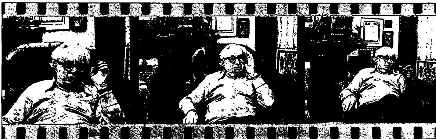
בביתו ברחביה, ירושלים: ניטשה העריך את היהדות על רצון החיים שבת. דבר אחד הוא לא סלח לה: שהולידה את הנצרות.

להכין פירוש ל"עיקרי התחייה", אותם מסכת עקרונות בסיסיים שניסח יאיר למשנת הלח"י (ביניהם: מלכות ישראל בגבולות ההבטחה ובניין בית-המקדש). לעובדה זו יש חשיבות רבה לאור הוויכוח שמתנהל כבר שנים בין יוצאי לח"י, שנפרצו לכיוונים שונים ומגוונים, מיהו הממשך האמיתי של תפיסת הלח"י ככלל ושל משנת יאיר בפרט.