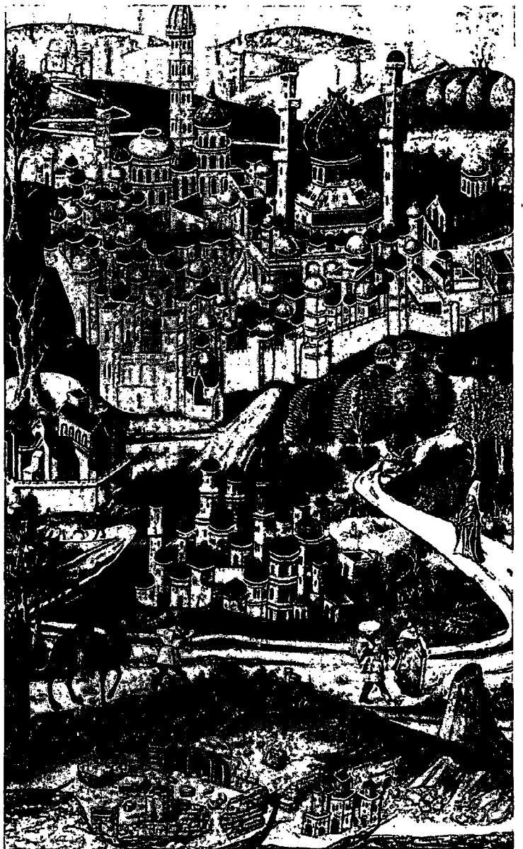
ציור דמיוני של ירושלים מימי הביניים המאוחרים.

אבל למעשה המחסום הוא בפני כוח חי במעמקי הנפש האנושית – ודווקא מפני שהוא כוח חי. זהו כוח שהיה במשך רוב תולדות האדם הכוח המכריע, וכוח כזה אינו נעלם לפתע – אס-כי הוא יכול להסתתר מאחורי מחיצה. על כל פנים, מי שמנסה להבין דבר וחצי דבר בעניין ירושלים מבלי לקחת את ממשות הכוח הזה ברצינות מלאה – אינו אלא מדשדש בשולי הנושא. אלא מה? אין זאת בעיה של איש זה או אחר: כאמור, התרבות שלנו, התרבות המערבית כולה, בנתה מחיצה בינה לבין הנושא הזה.