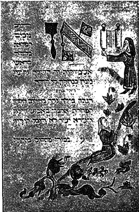
דף מתוך הגדה מן המאה ה-15

ורק לאחר שהאיש, ההדיוט או המלומד, מקרב את המאורע למסגרת תפישתו, תנוה עליו דעתו, ומה שאמר הפילוסוף הגדול קאנט על כבילת הכרתו של האדם בדרכי תפישת הרוח האנושי, שהחלל והזמן הם אופן אחד שלהם והקטיגוריות, מהן החשובה ביותר, הסיבתיות, אופן אחר, נכון גם לגבי התפישות ההיסטוריות, גם כאן ישנה רשת מסוימת, ומה שאינו עולה ברשת זו של מושגים, ההיסטוריון שולל את קיומו, כאדם זה שהוא דלטור ניסט, עיוור צבעים, וצבעים שאינו קולט אותם, אינם קיימים לידו, או אותם קולט מעל למהירות מסדר יימת שאון האדם איוה קולטת אותם עוד, ואילו התרחש מה שהתרחש בימינו, לגבינו, בש-גי התחומים, בגולה להשמדת ששה מיליונים בבת אחת ובארץ, לנצחון קומץ יהודים על שבע מדי-נות ערב ונגד רצונה של אימפריה בריטית שלטת,