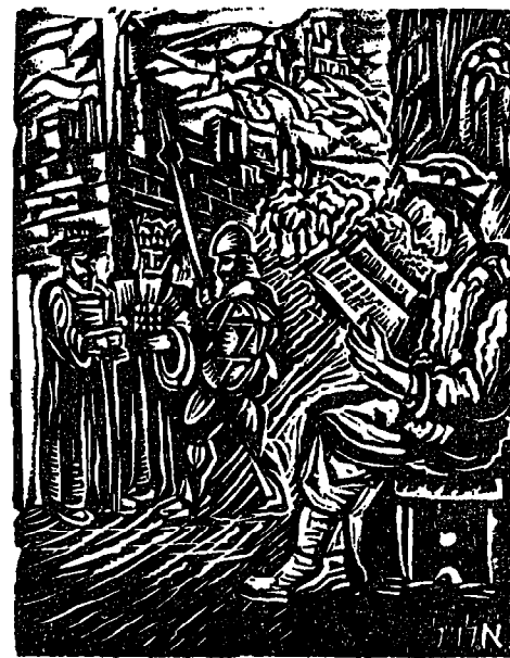
ואעשך לגוי גדול" • א. אלואיל

כן, ממש כשם ששום הסבר ראצינאלי לא הצ' ליה עד סה על תופעה זו של קיום עם ישראל, על אי-מותו על עם זה, על עמים בכורים לאין ספור ירד המוות, ומותם של עמים נעשה לדרך הטבע, גם כשהם שרויים בתנאים נוחים, על אד' תם, ללא לחץ, ואין צריך לאמור שעמים, אף גדולים, אשר נתפזרו בארצות אחרות, או אשר אר' צותיהם נכבשו על ידי אימות אחרות, אבדו מן העולם, אם על ידי השמדה פיסית אם על ידי טמיעה תרבותית. והנה עם ישראל קיים, ששוטן כמשמעו: מלאך המוות ההיסטורי, פוטח עליו, הוא פסח עליו גם בדורנו כאשר לא דם כבש, כי אם דמו שלו עצמו נשפך כים. וגם את הים הזה הוא עבר ונש' אר חי.