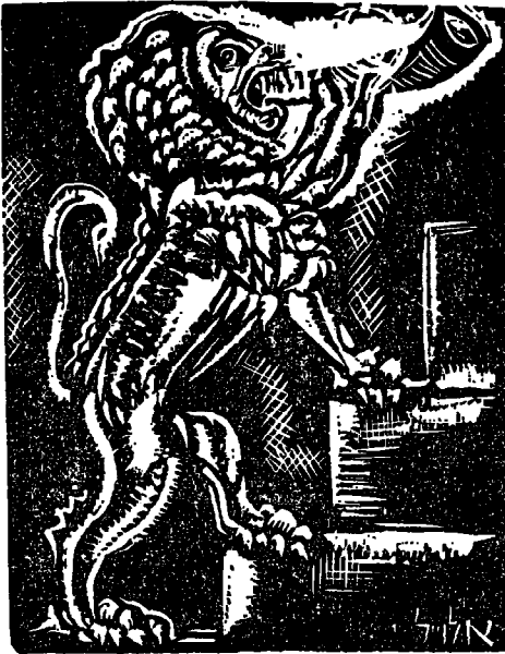
ביום ההוא יתקע בשופר גדול" • א. אלואיל

רא המנסה לספר את סיפור תולדות ישראל על דרך "הטבע" ההיסטורי. אלא שבכך כבר הגענו לעיקרו של נושא היום. הלא הוא מושג פסח המתעלה לדרגת סמל מרכזי.